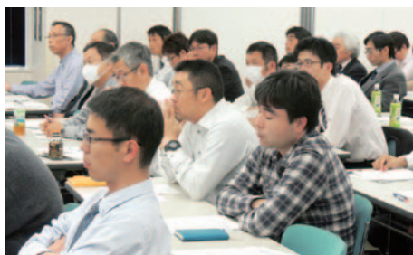
11月30日(土) 大分県電力総連政治研修会