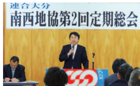
12月14日(土) 連合大分南西地域協議会第2回定期総会