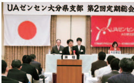
10月19日(土) UAゼンゼン大分県支部第2回定期大会