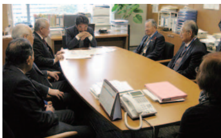
10月29日(火) 東九州自動車道、中九州横断道路に関する要望への対応