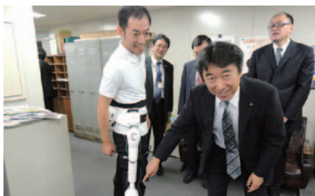
10月7日(月) 福祉用ロボットスーツ HALの事業展開「東九州メディカルバレー構想」の一環として