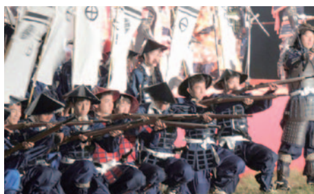
11月9日(土) 第9回大野川合戦まつり