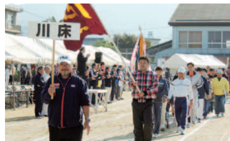
10月27日(日) 第29回戸次地区体育祭