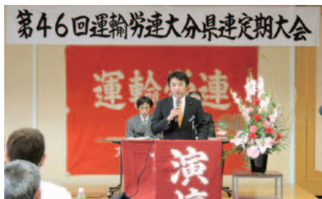
10月19日(土) 第46回運輸労連大分県連定期大会