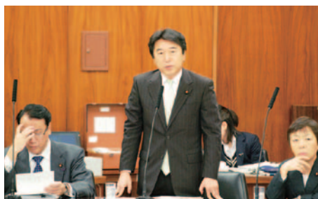
11月19日(火) 参議院厚生労働委員会薬事法改正案及び再生医療等の安全性の確保等について質疑