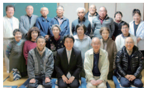
11月17日(日) 足立信也とかたる会 (挾間町)