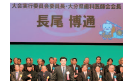
11月16日(土) 全国歯科保健大会