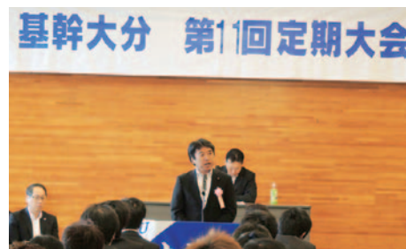
10月12日(土) 基幹労連大分県本部第11回定期中間大会ならびに結成10周年祝賀会