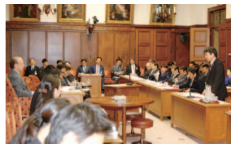
11月27日(水) 政治倫理の確立及び選挙制度に関する特別委員会